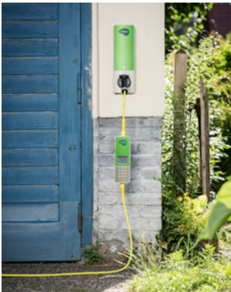
An der Wand im Innen- und Außenbereich