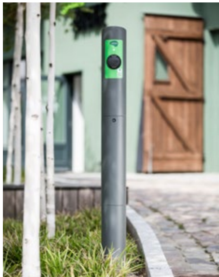
Freistehend als Einzel-/Doppelpoller